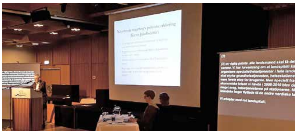
Allt sem fram fór á ársfundinum var samtímis rittúlkad og varpað upp á sýningartjöld.

Lesendur geta kynnt sér meira um Máltækniáætlunina á eftirfarandi heimasíðum: stjornarradid.is , sa.is , lvl.ru.is , facebook.com/almannaromur .