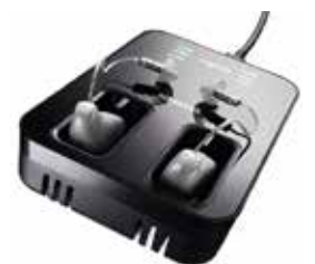
Pure Charge&Go Nx ásamt hleðslustöð

Nánari upplýsingar á signia-pro.com/signia-nx eða hjá söluaðila á Íslandi: Heyrnar-og talmeinstöð Íslands