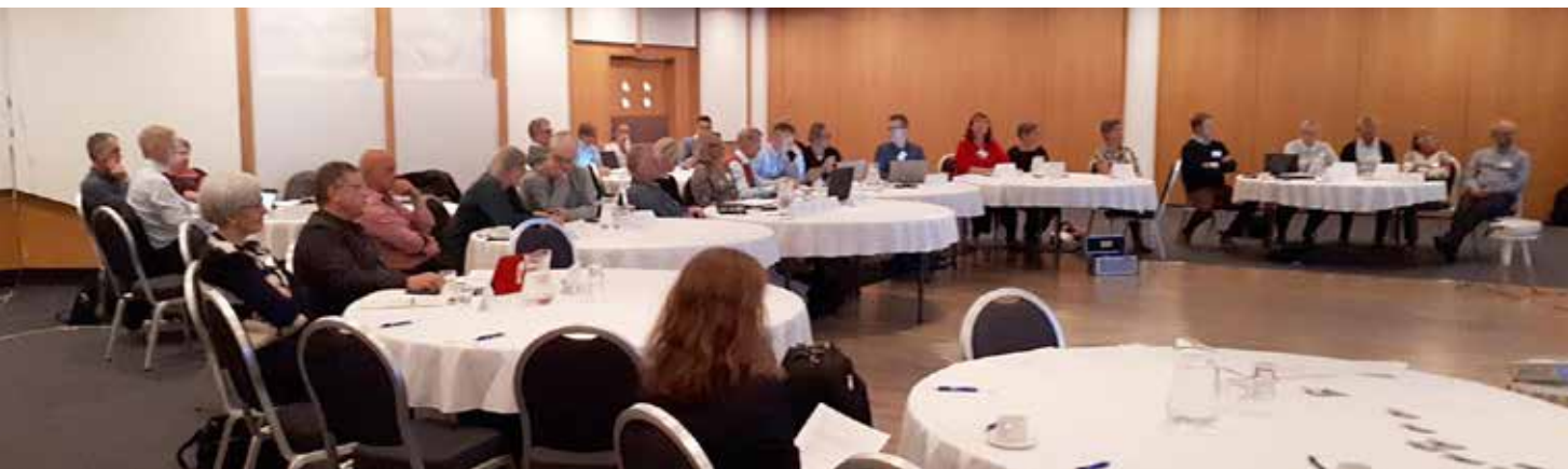
Hér má sjá hluta þátttakendanna í hinni ágætu ráðstefnuaðstöðu á Hótel Selfossi.

og ensku. Nefna má þó að Google talgreinin og þýðingaforritið er hægt að nota á íslensku, sem og Microsoft Translator appið.